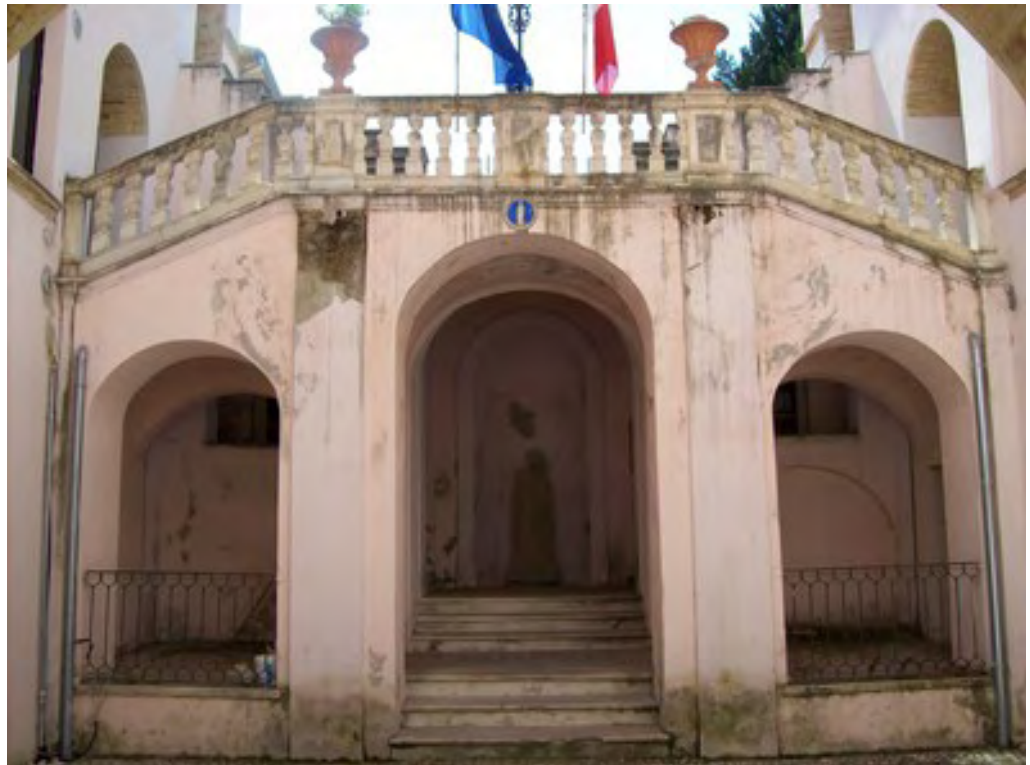
Penne, Palazzo Caracciolo-De Simone, particolare del portale lapideo e scalinata del cortile.