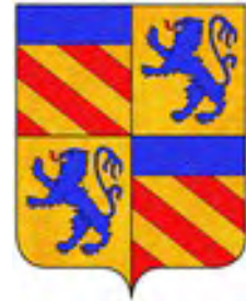
Caracciolo di Forino