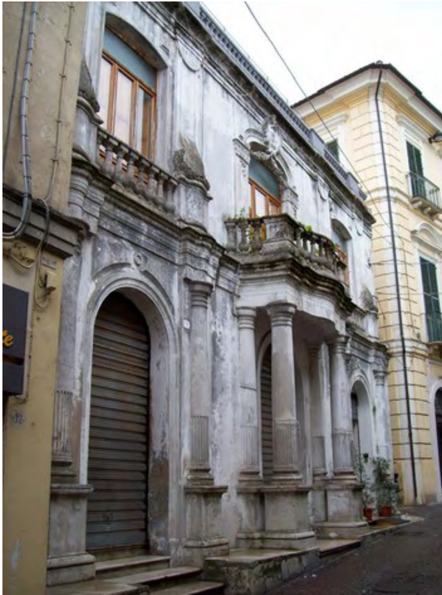
Penne, Palazzo Caracciolo-De Simone, facciata sul Corso E. Alessandrini.