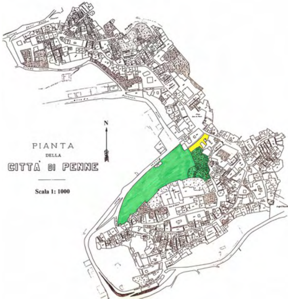
Planimetria Catastale della Città di Penne, 1939 - 40