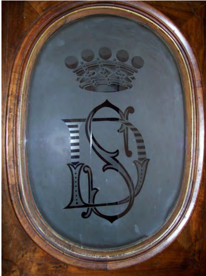
Penne, Palazzo Caracciolo-De Simone. Ingresso del piano nobile, particolare della vetrata.