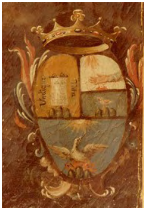
Penne, Museo del Convento di Colleromano. Domiziano Vallarola, Pala della Vergine Addolorata, particolare dello stemma De Simone.