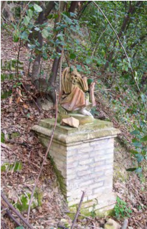
Penne, Parco Caracciolo-De Simone, ingresso sulla Circumvallazione e basamento con resti di statua in terracotta.