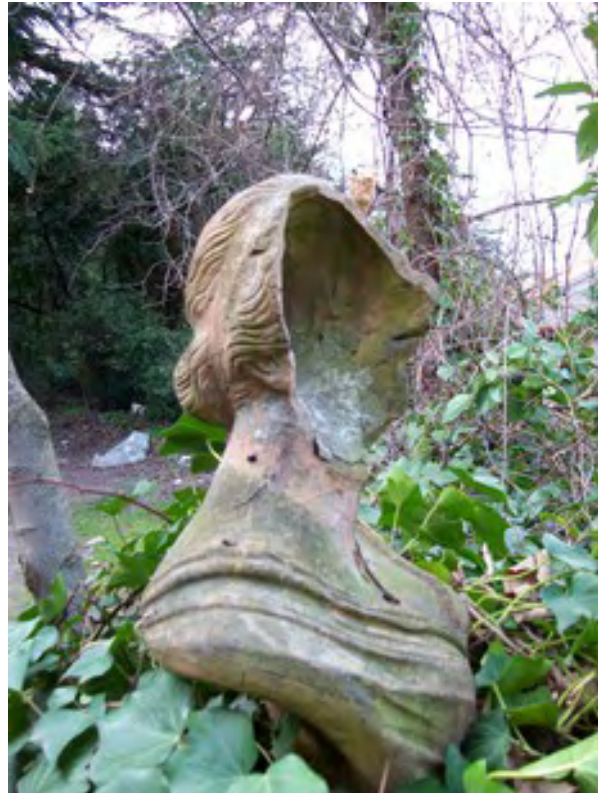
Penne, Parco Caracciolo-De Simone, busti in terracotta.