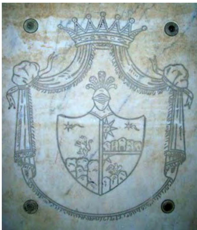
Penne, corridoio del cortile del Convento di Colleromano. Stemma De Sanctis-De Simone.